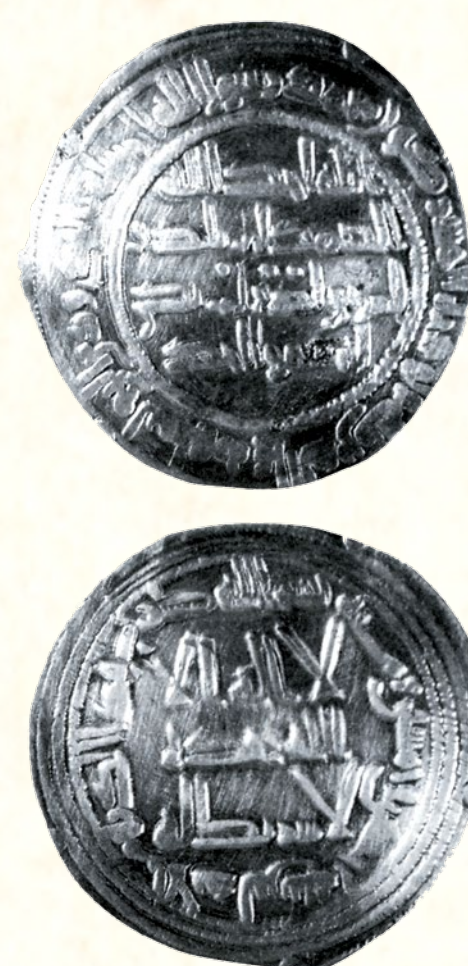
Anvers i revers d'un dirhem emiral de la Cova del Randero (Pedreguer), Segle IX Anverso y revers de un dirhem emiral de la Cueva del Randero (Pedreguer), Siglo IX Head and reverse of an emirate dirhem coin from Cueva del Randero (Pedreguer), 9th century

Quan i perquè foren construïts? Aquesta qüestió en molts casos sols es podrà contestar mitjançant l'arqueologia. Per a trobar algunes proves haurem de mirar enrere i fixar-nos en els períodes històrics.