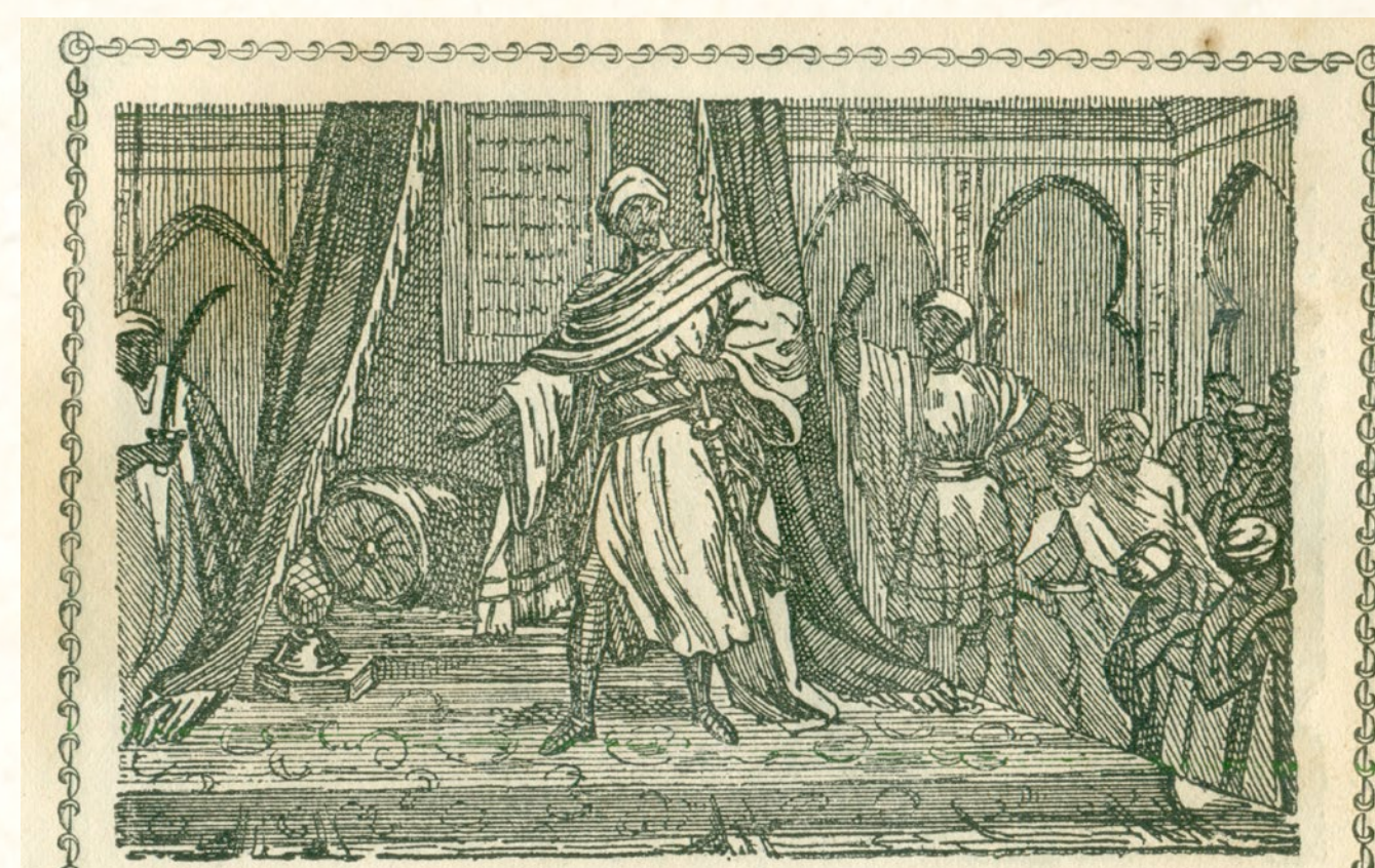
Creació del califat de Còrdova per Abderrahman III. Gravet del segle XIX Creación del califato de Córdoba por Abderrahman III. Grabado del siglo XIX Creation of Córdoba's caliphate by Abderrahman III. Pictured in the 19th century