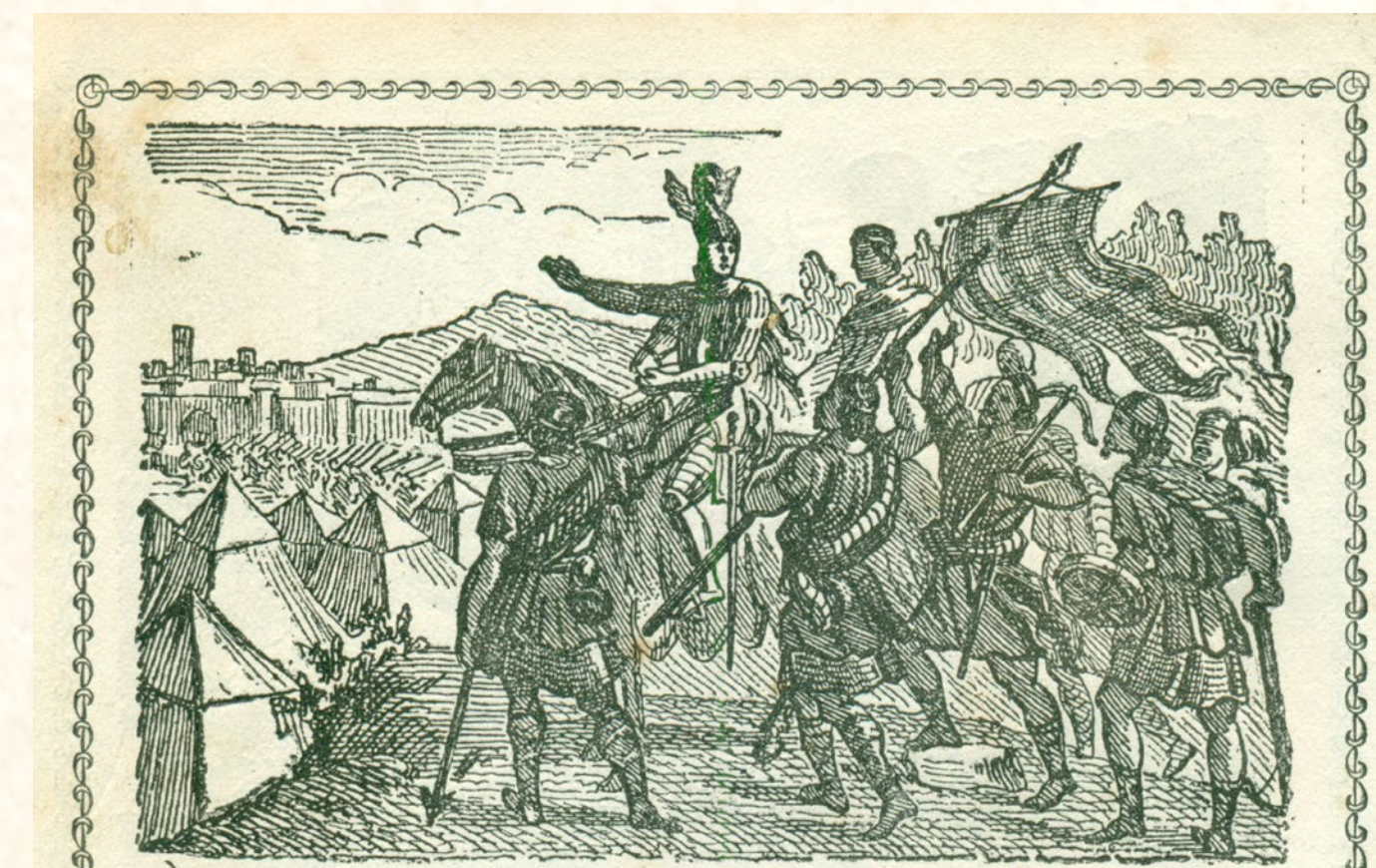
Jaume I conquesta la ciutat de València. Gravet segle XIX Jaume I conquista la ciudad de Valencia. Grabado del siglo XIX Jaume I conquest the city of Valencia. Pictured in the 19th century