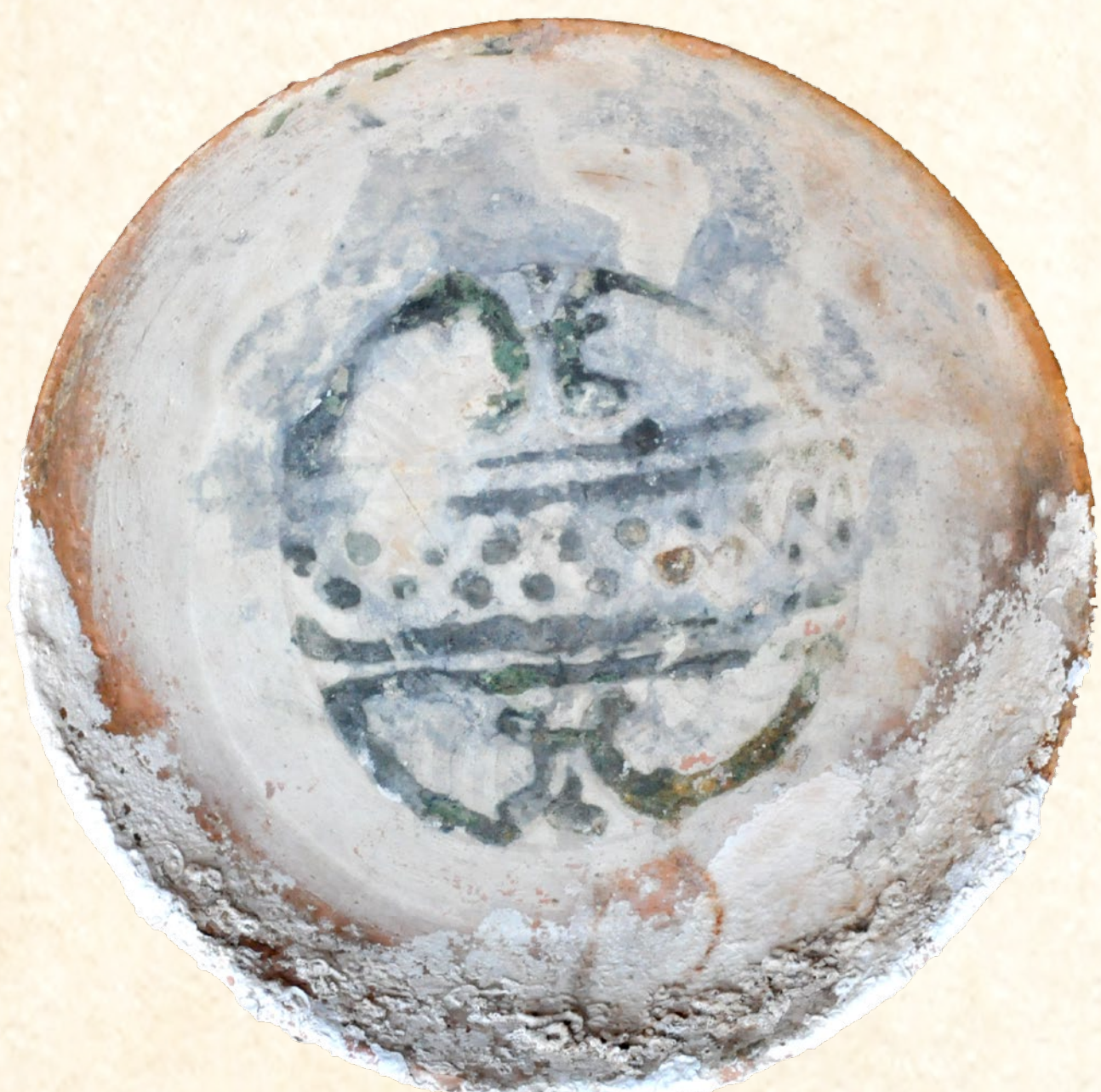
Safa amb esmalt estannífer decorada en verd i maganés de la badia del Portitxol (Xàbia), Segle XI Atafor con esmalte estannífero decorado en verde y manganeso de la bahía del Portitxol (Xàbia) Siglo XI Plate with tin glaze, decorated in green and manganese from the bay of Portitxol (Xàbia) 11th century

Des de la conquesta al Califat. El 711 una incursió militar d'uns pocs milers d'homes procedents del nord d'Àfrica desembarquen a la península per Gibraltar. L'escassa resistència i la política de pactes desenrotllada pels musulmans, incorporà en poc de temps la península Ibèrica al califat omeia de Damasc; naixia així Al-Andalus. En els anys següents arriben milers de reforços i en el 714 València cau sense cap lluita.