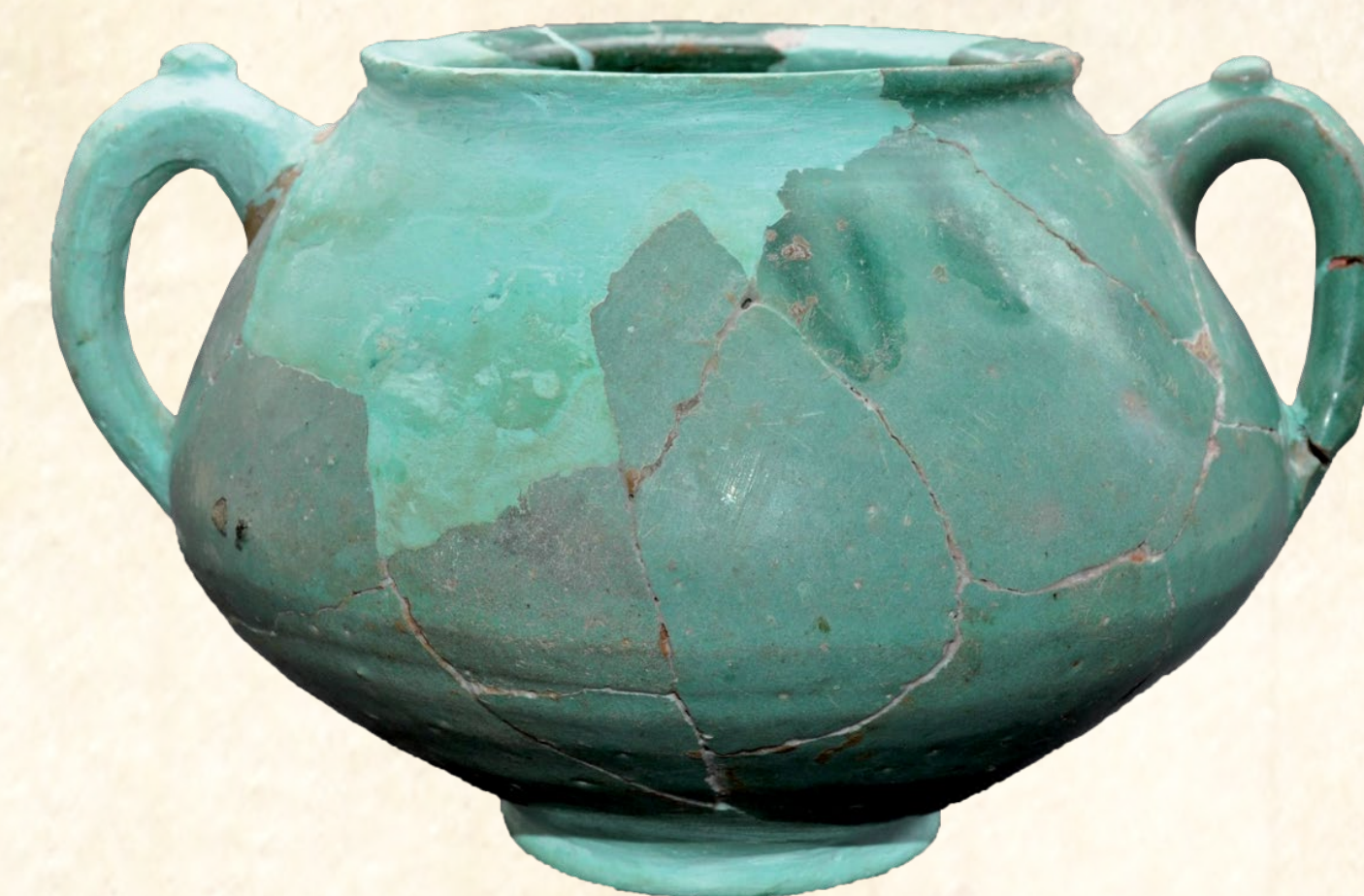
Orseta amb esmalt turquesa de la cova del Barranc del Migdia (Xàbia), Segles XII-XIII Orseta con esmalte turquesa de la cueva del Barranc del Migdia (Xàbia), Siglos XII-XIII Small jar with turquoise glaze from the cave of Barranc del Migdia (Xàbia), 12th - 13th centuries