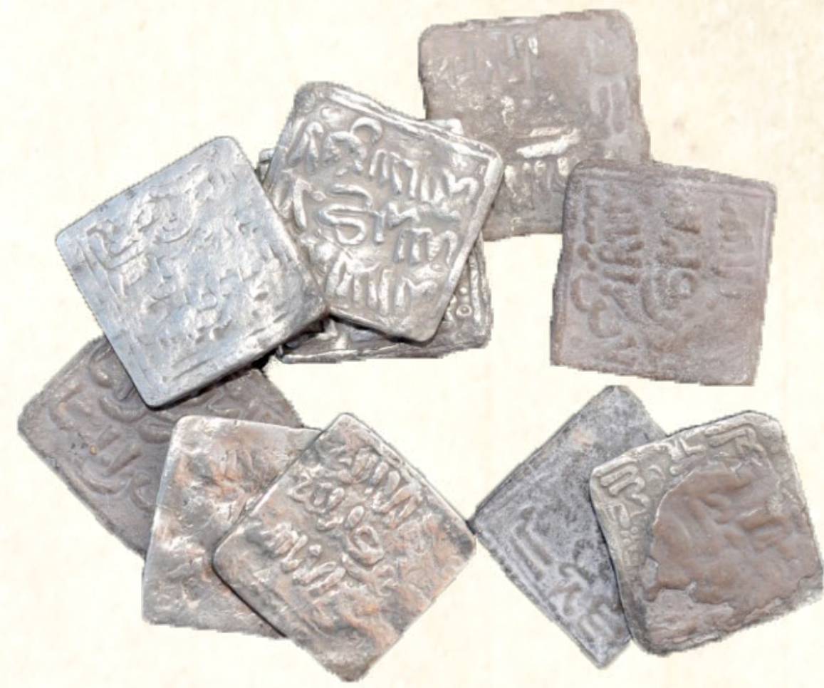
Conjunt de dirhems almohades de la cova del Barranc del Migdia (Xàbia), Segles XII-XIII Conjunto de dirhems almohades de la cueva del Barranc del Migdia (Xàbia), Siglos XII-XIII Set of Almohad dirhems from the cave of Barranc del Migdia (Xàbia), 12th - 13th centuries