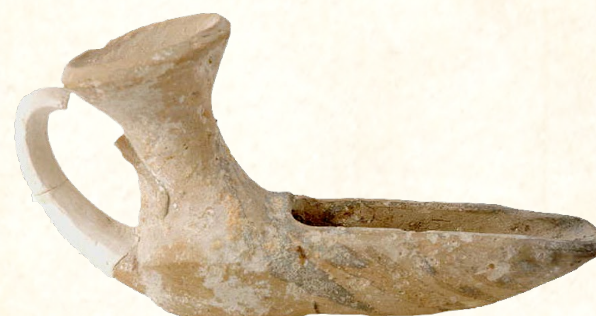
Cresol de piqueta de la Cova Tallada (Xàbia), Segle XII Lámpara de piqueta de la Cova Tallada (Xàbia), Siglo XII Beak lamp from Cova Tallada (Xàbia), 12th century