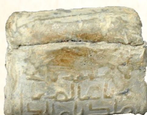
Amulet de plom. Castell d'Aixa (Xaló) Amuleto de plomo. Castell d'Aixa (Xaló) Lead amulet. Castell d'Aixa (Xaló)