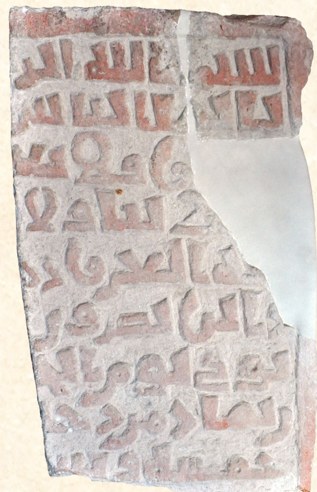
Inscripció funerària àrab de la "maqbara" (cementerio) de Cap de Martí (Xàbia), Any 1199 Inscripción funeraria árabe de la "maqbara" (cementerio) de Cap de Martí (Xàbia), Año 1199 Moorish funerary inscription from the "maqbara" (cemetery) of Cap de Martí (Xàbia). Dated 1199