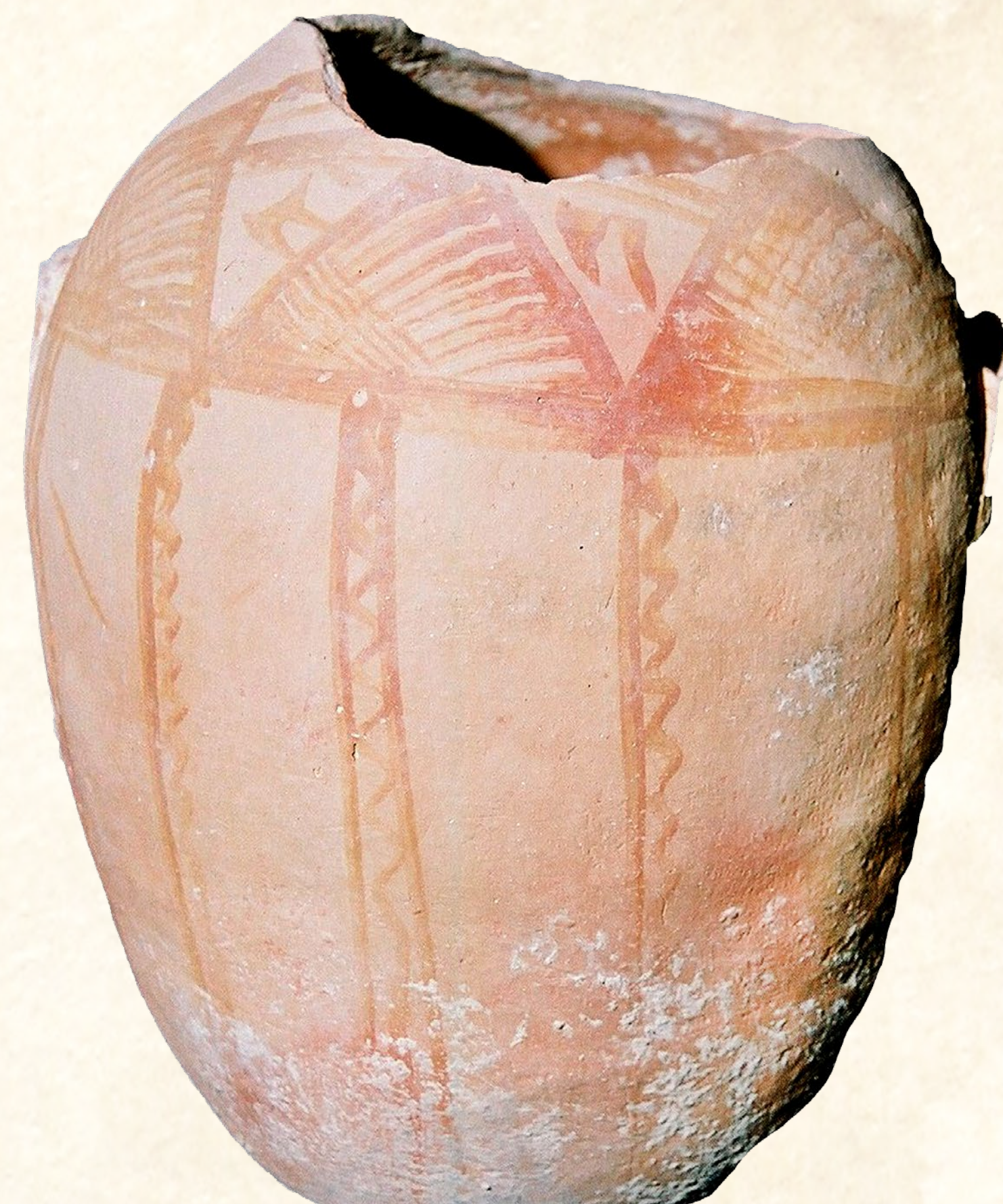
Canter fragmentat trobat a l'Atzúbia (Xàbia) amb decoració pintada en manganés. Segle XII Cántaro fragmentado encontrado en la Atzúbia (Xàbia) con decoración pintada en manganeso. Siglo XII. Broken jug found in Atzúbia (Xàbia) with decoration painted in manganese. 12th century

Els regnes de Taifa. En el 1009, un període d'instabilitat i guerra civil conegut com la "fitna" va portar a la descomposició del califat de Còrdova i l'establiment de petits dominis coneguts com "regnes de taifa". La taifa de Dènia es va fundar en 1010 per un alt funcionari fugit del califat, Muyaahid. El succeirà el seu fill Ali ibn Muyaahid fins el 1076. A partir d'aquell moment Dènia es converteix en el centre polític i administratiu d'un ampli territori, amb una frontera marítima que anava des d'Oriola fins al Xúquer, mentre per l'interior arribava fins a la serra de Segura. A partir de 2014, també va incloure les illes Balears. A més, atraurà a molts artesans i artistes, i es transformarà en un important centre comercial de la mediterrània occidental. És en aquest període quan el castell de Dènia comença a fortificar-se i la ciutat es rodeja de muralles.