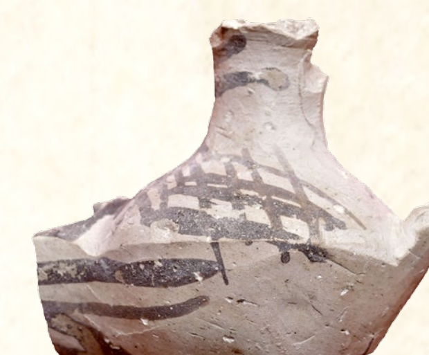
Cresol de piqueta fragmentat de l'Assegador de la Torre (Teulada), Segle XII Lámpara de piqueta fragmentada del Assegador de la Torre (Teulada), Siglo XII Fragmented beak lamp from Assegador de la Torre (Teulada), 12th century