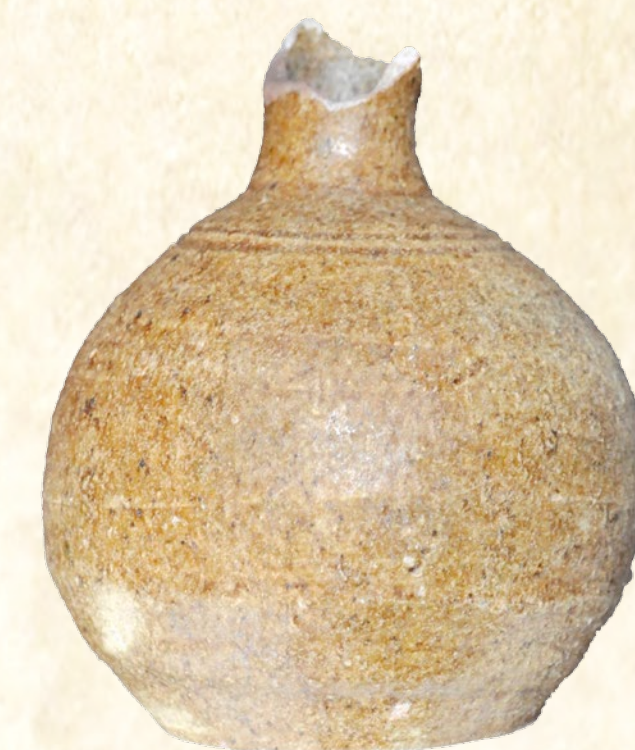
Setrill fragmentat amb esmalt melat de l'Assegador de la Torre (Teulada), Segle XII Acetiera fragmentada con esmalte melado del Assegador de la Torre (Teulada), Siglo XII Small jar with honey colour glaze from Assegador de la Torre (Teulada), 12th century