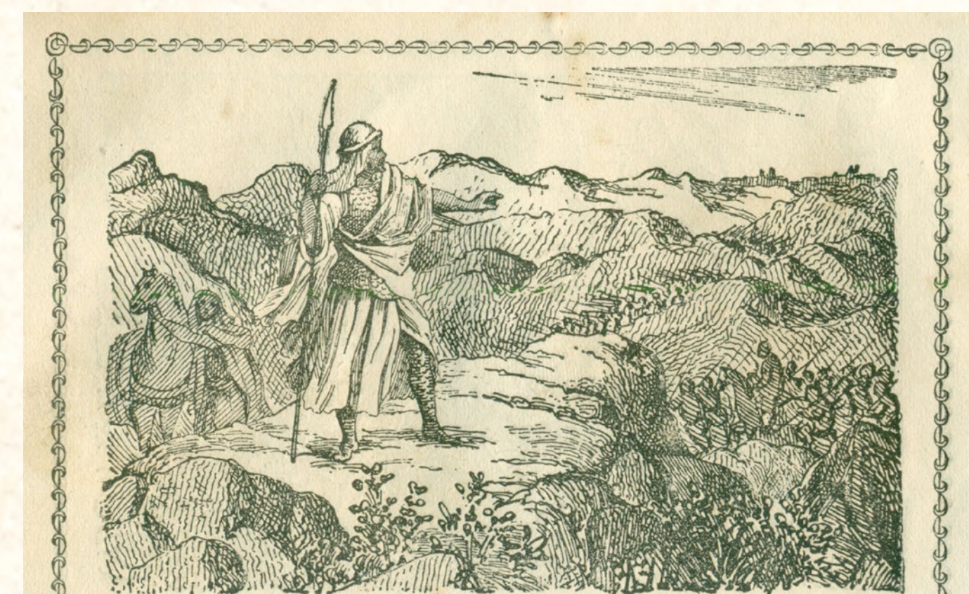
Conquesta musulmana de la Península Ibèrica. Gravet del segle XIX Conquista musulmana de la Península Ibèrica. Grabado del siglo XIX Muslim conquest of the Iberian Peninsula. Pictured in the 19th century